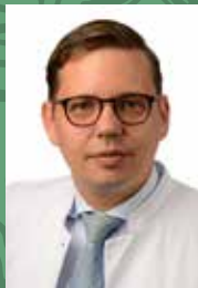
Prof. Dr. med. M. Canis Direktor der Klinik